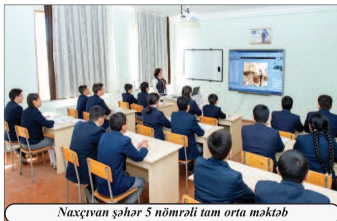
Naxçıvan şəhər 5 nömrəli tam orta məktəb