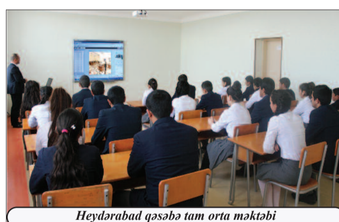
Heydərabad qəsəbə tam orta məktəbi

görən ən böyüyü 31 mart soyqırımındır. 1918-ci ilin martında törədilmiş bu qanlı faciə paytaxt Bakı şəhəri də daxil olmaqla, ölkəmizin bir sıra regionlarını, o cümlədən muxtar respublikamızı da əhatə edib. 1905-1907, 1918-1920, 1988-1992-ci illərdə xalqımıza qarşı soyqırımı törədilməsində əsas məqsəd torpaqlarımızın işğalı və “böyük Ermənistan” dövlətinin yaradılması idi. Hazırda muzeydə bu faciəli hadisələri özündə əks etdirən müxtəlif fotosəkillər, xəritələr və sənədlər nümayiş etdirilir.